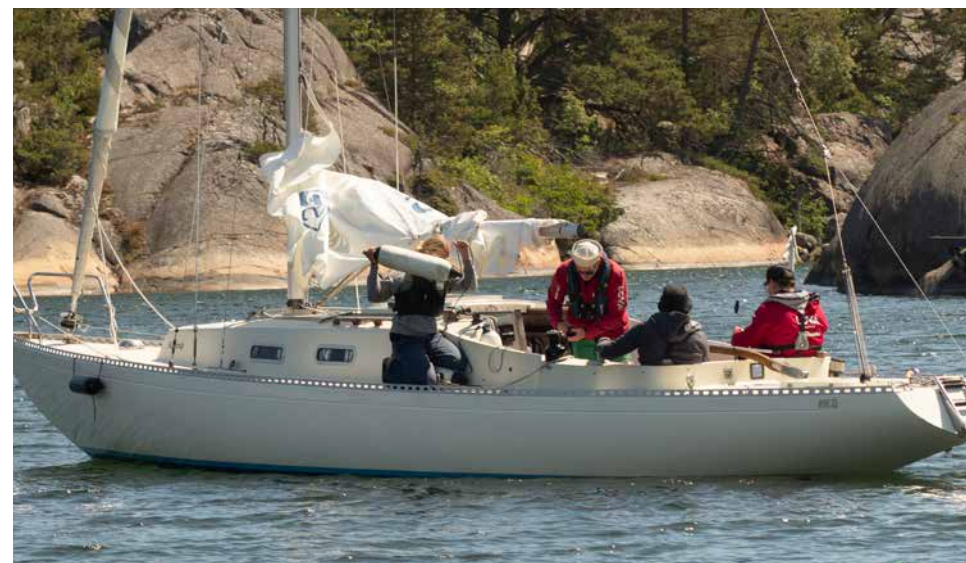
LOVA – segla högre