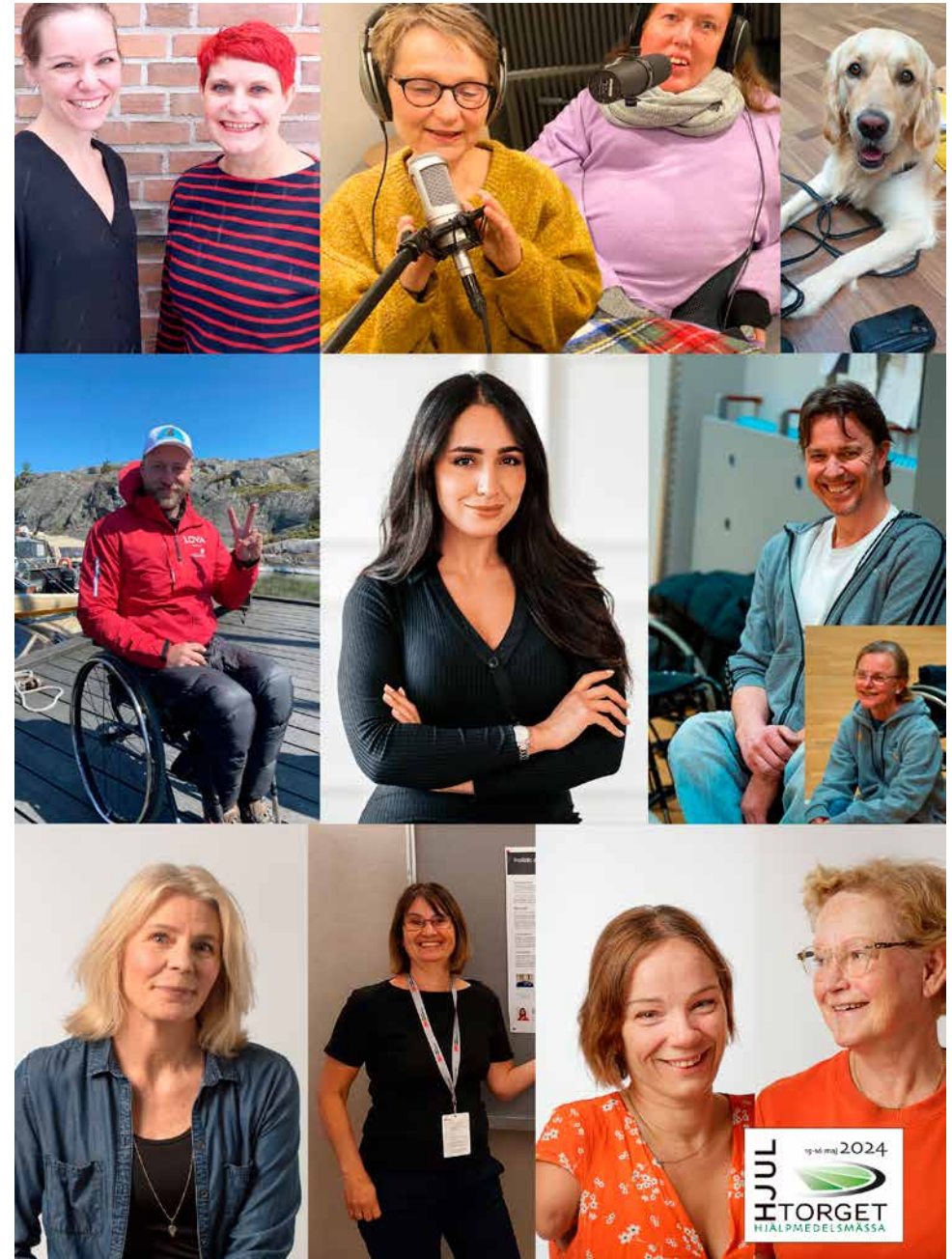
Föreläsare under mässan Hjultorget