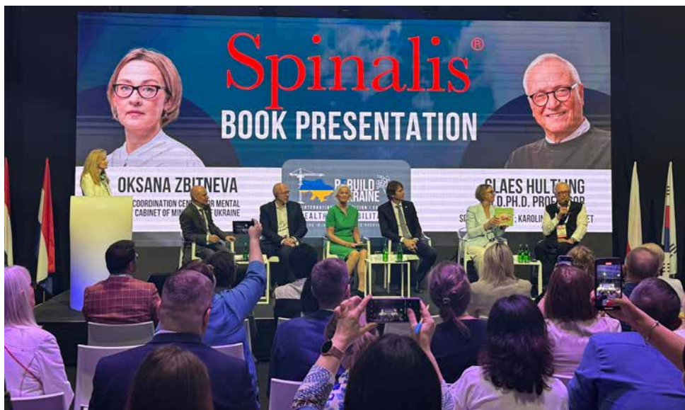
Bokpresentation på mässan ReBuild Ukraine i Warszawa.