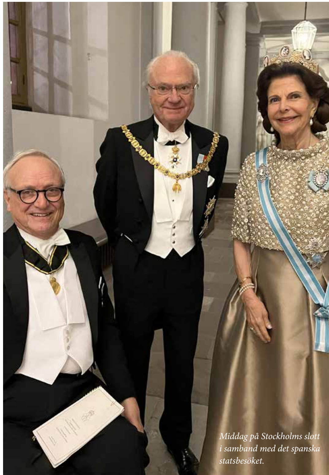
Middag på Stockholms slott i samband med det spanska statsbesöket.

Under våren 2021 fick stiftelsen ett glädjande besked att Arvsfonden godkände ett treårigt projekt ”DRIV – hälsa online för dig med ryggmärgsskada”.